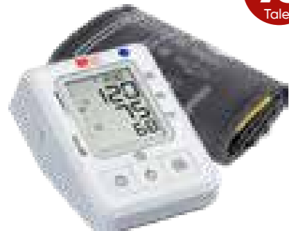
aponorm® Basis Control Oberarm-Blutdruckmessgerät