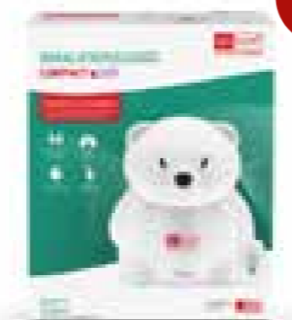
aponorm® Inhalator Compact KIDS