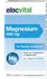
Elac Vital - Magnesium 400 mg Tabletten

Magnesium ist ein Mineralstoff, der an vielen wichtigen Stoffwechselprozessen beteiligt ist. Da er vom Körper nicht selbst gebildet werden kann, muss er dem Körper in ausreichender Menge zugeführt werden. Ein ausgewogener Magnesiumspiegel unterstützt die normale Funktion von Muskeln und Nerven, trägt zum normalen Energiestoffwechsel bei und ist daher sinnvoll für die Aufrechterhaltung eines aktiven Lebensstils.