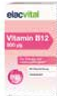
Elac Vital - Vitamin B 12

Energie und Leistungsfähigkeit sind wichtig, um den Anforderungen übermäßiger körperlicher und geistiger Belastung gerecht zu werden. Vitamin B 12 spielt dabei eine wichtige Rolle im Energiestoffwechsel. elacvital Vitamin B 12 500 µg enthält hochdosiertes Vitamin B 12 , das dem Körper, dank der Depotwirkung, gleichmäßig bereitgestellt wird. Für eine langfristige Vitamin B 12 Versorgung – auch für Vegetarier und Veganer geeignet.