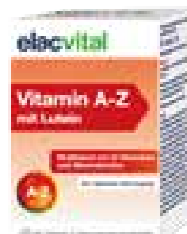
Elac Vital - Vitamin A-Z

Eine ausgewogene Ernährung mit Vitaminen, Mineralstoffen und Spurenelementen ist die Basis für Leistungsfähigkeit und Wohlbefinden. Erhöhte körperliche Belastung, stressige Phasen oder eine unausgewogene Ernährung können zu einem erhöhten Nährstoffbedarf führen. elacvital Vitamin A-Z mit Lutein enthält 24 aufeinander abgestimmte Mikronährstoffe und das Carotinoid Lutein, die den Tagesbedarf wichtiger Nährstoffe decken.