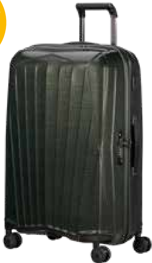
Samsonite Koffer Major Lite