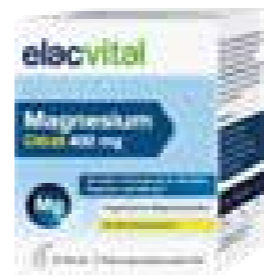
Elac Vital - Magnesium Citrat 400 mg

Während intensiver körperlicher Aktivitäten oder in belastenden Phasen des Alltags kann der Magnesiumbedarf erhöht sein. Da unser Körper auf externe Zufuhr von Mineralstoffen angewiesen ist, müssen sie in ausreichender Menge mit der Nahrung zugeführt werden. elacvital Magnesium Citrat 400 mg enthält organisches Magnesiumcitrat, das gut vom Körper aufgenommen werden kann und gezielt und rasch Muskeln, Knochen und Nerven versorgt. Als Pulver zum Auflösen und Trinken – mit Zitronengeschmack.