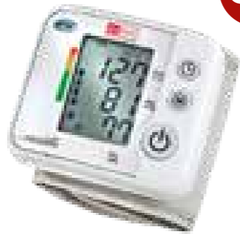
aponorm® Mobil Basis Handgelenk-Blutdruckmessgerät