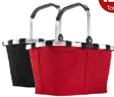
Reisethel Korb versch. Farben