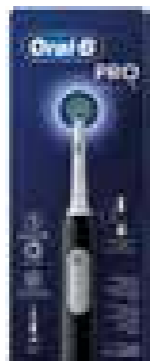
Oral-B PRO elektrische Zahnbürste