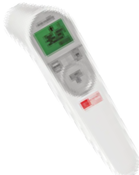
aponorm® Stirnthermometer Contact Free 4