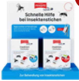
mosquito® by heat it Insekten-Stich-heiler HV Display