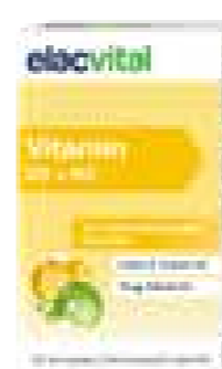
Elac Vital - Vitamin D3 + K2

Die Kombination aus Vitamin D 3 und Vitamin K 2 spielt eine wichtige Rolle beim Knochenerhalt. Vitamin D 3 unterstützt die Aufnahme und Verwertung von Calcium, während Vitamin K 2 als Cofaktor verschiedener Knochenproteine beteiligt ist. Mit nur einer Tablette elacvital Vitamin D 3 + K 2 wird der tägliche Bedarf von Vitamin D 3 und Vitamin K 2 gedeckt.